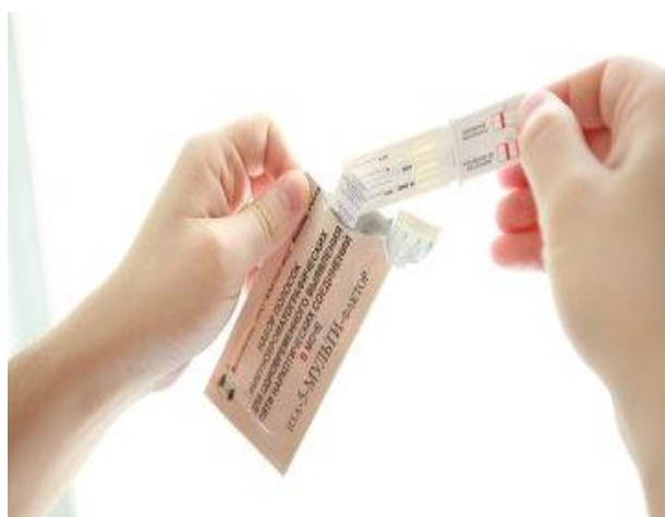
Рис. 1 Извлечение планшета из упаковки

Во время обследования к медицинскому работнику, учащиеся подходят по одному и получают стакан. Моча в количестве 50 мл собирается испытуемым в полученный пластиковый стакан, который он/она отдает медицинскому работнику. Медицинский работник вскрывает упаковку планшета теста, разрывая ее вдоль прорези, извлекает планшет и погружает его строго вертикально концом со стрелками в мочу до уровня ограничительной линии на 20-30 сек. (Рис. 1, 2).